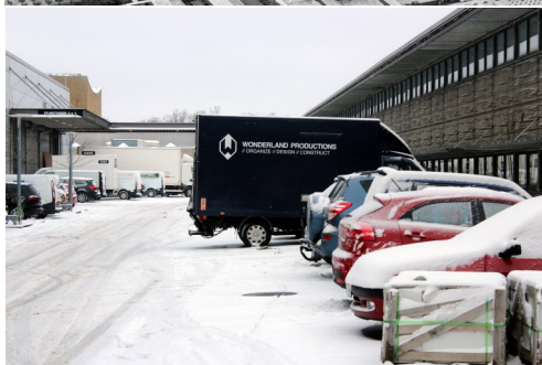
Luftfotoet er fra dengang, DR ejede hele området. På det nye billede ses toppen af et af de gamle tv-studier til venstre. I bygningen til højre finder man Regner Grasten Film .